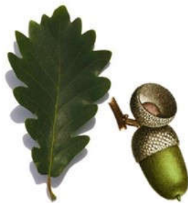
Kocsánytalan tölgy (levél kocsánya hosszabb termés kocsánytalan, ülő)