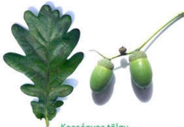
Kocsányos tölgy (levél kocsánya rövid termés kocsánya hosszú)